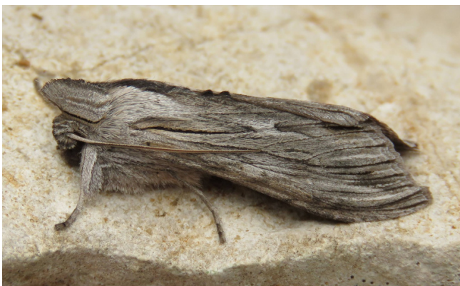
Cucullia santolinae Rambur, 1834