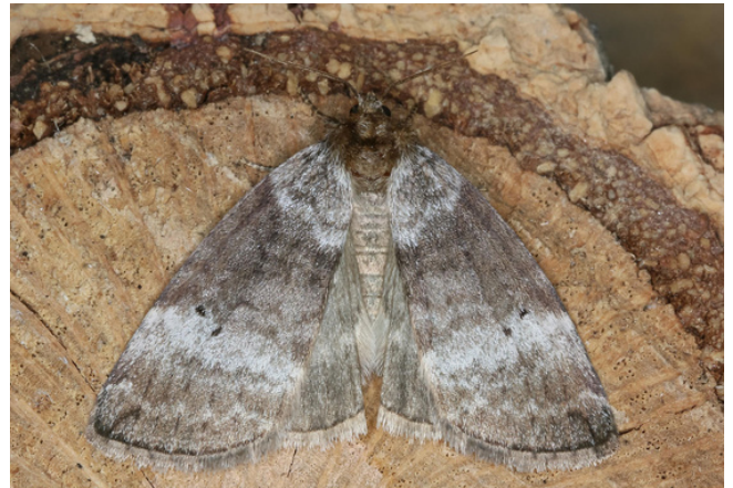
Ochropacha duplaris (Linnaeus, 1761)