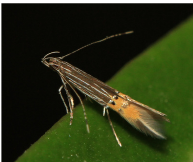
Cosmopterix coryphaea (Walsingham, 1908)

Thijs Valkenburg vive em Olhão, onde é um ativo ornitólogo, trabalhando para o RIAS, um centro de recuperação de animais selvagens. As suas adições à lista portuguesa incluem Cosmopterix coryphaea e Merulempista turturella .