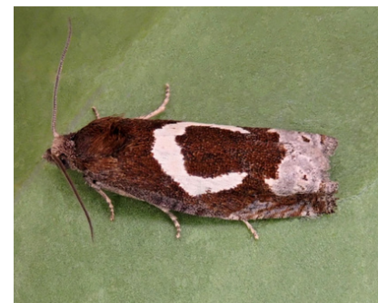
Epiblema foenella (Linnaeus, 1758)