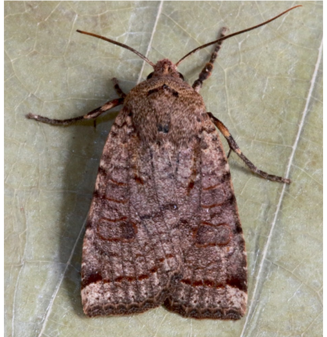
Conistra intricata (Boisduval, 1829)