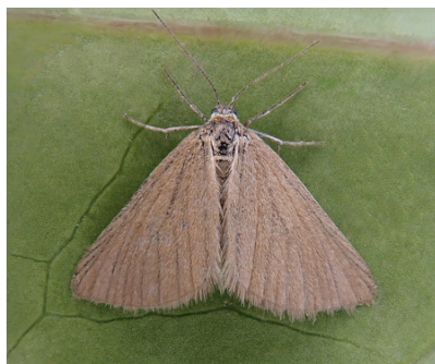
Minoa murinata (Scopoli, 1763)