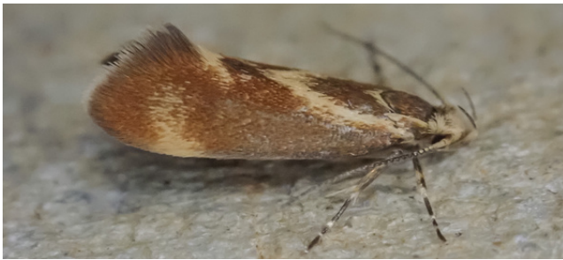
Metalampra italica Baldizzone, 1977