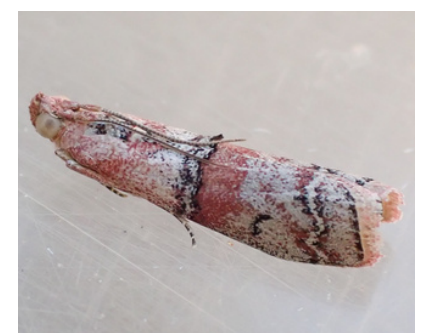
Merulempista turturella (Zeller, 1848)