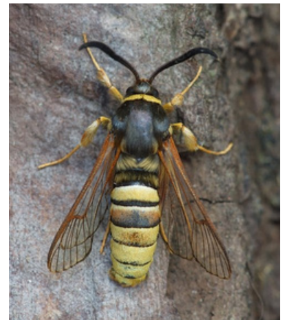
Sesia bembeciformis (Hübner, 1806)