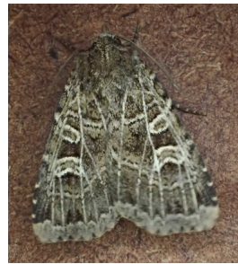
Naenia typica (Linnaeus, 1758)