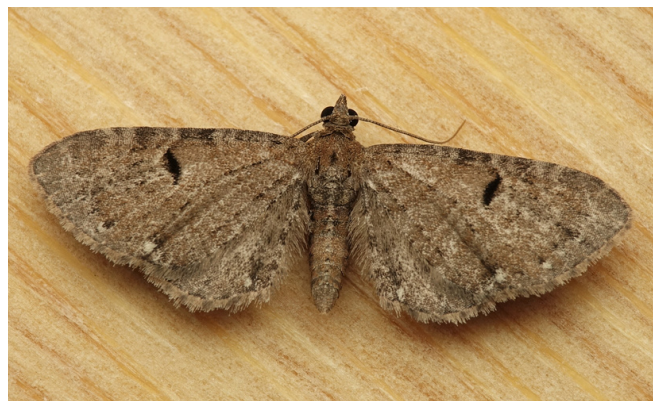
Eupithecia assimilata Doubleday, 1856